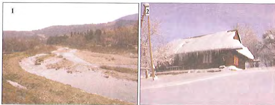
Fot. 1. Dolina Soly w okolicach Rajczy.