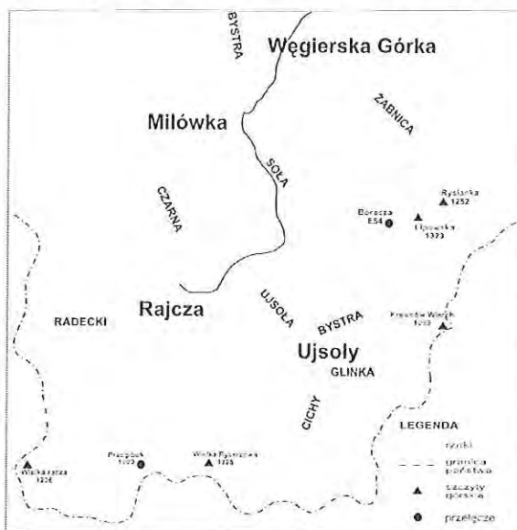
Ryc. 1. Położenie badanych gmin na tle dorzecza górnej Soly.

Zakres przestrzenny pracy obejmuje cztery najbardziej wysunięte na południe gminy powiatu żywieckiego: Ujsoly, Rajcze, Milówkę, Węgierską Górką (ryc. 1).